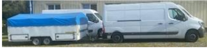
Ensemble roulant de 13 mètres

Coupage de l'éclairage public sur les lieux.